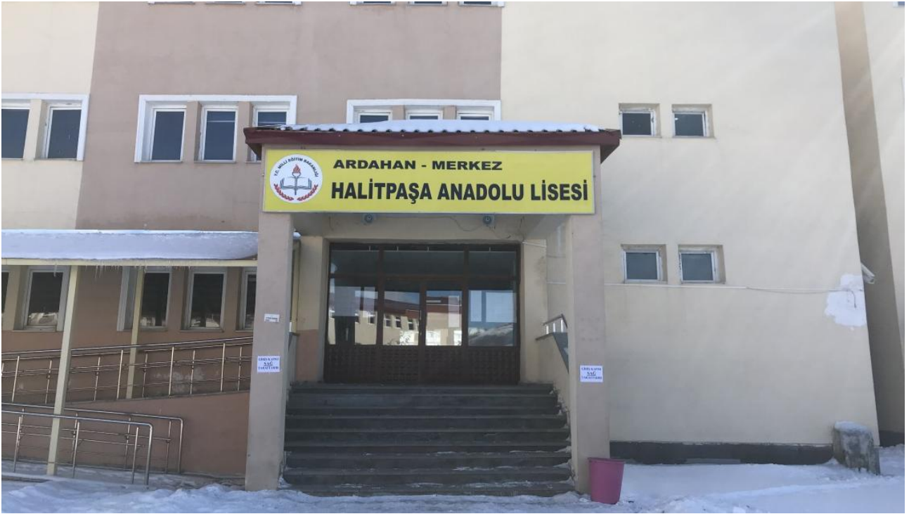
ARDAHAN HALİTPAŞA ANADOLU LİSESİ ANA BİNASI