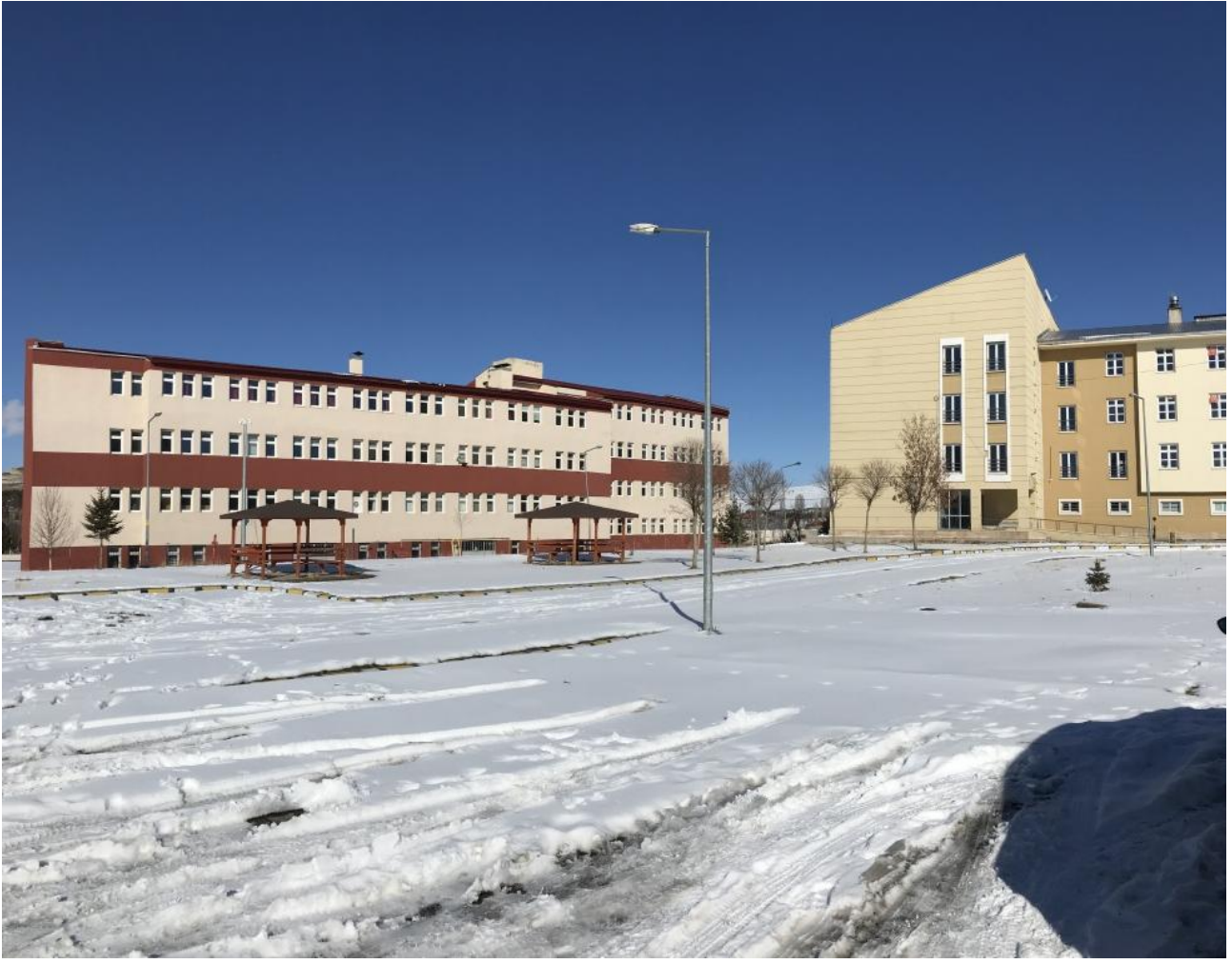
ARDAHAN HALİTPAŞA ANADOLU LİSESİ BİNASI